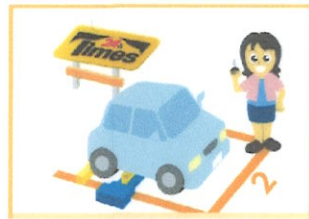
ロック板式駐車場→駐車証明書

・駐車サービス券は 駐車券 の呈示、または、 駐車証明書 との引き換えでお渡しさせていただきます