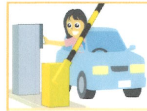
ゲート式駐車場→駐車券